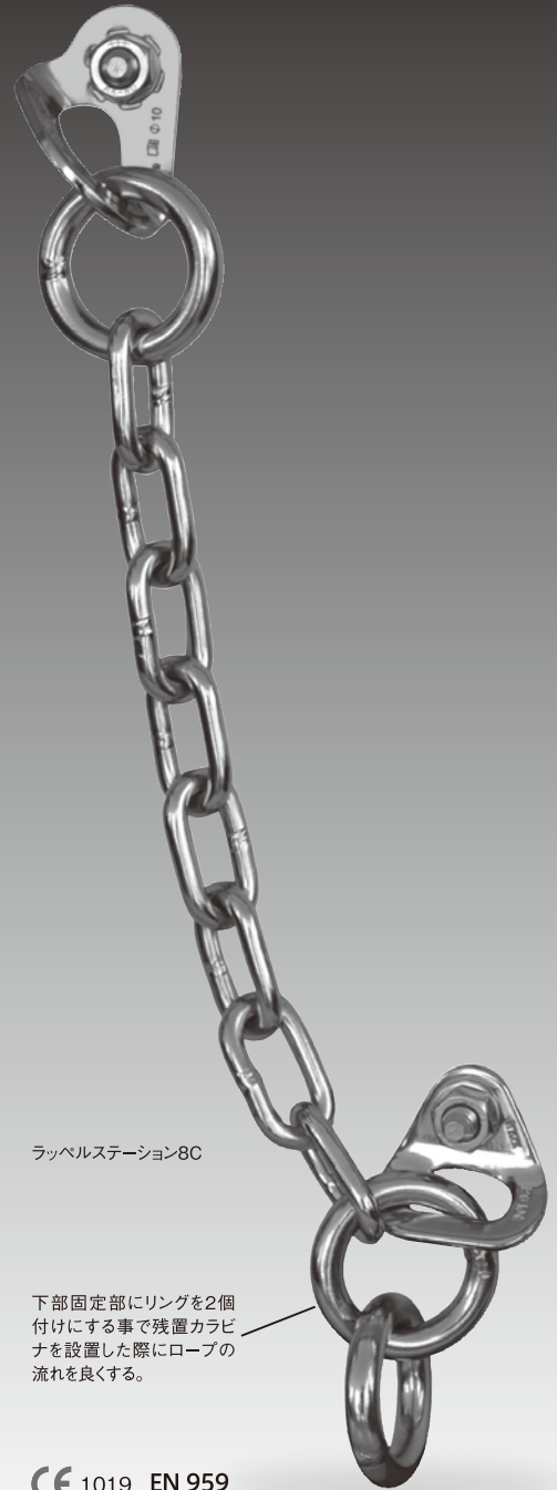
ラッペルステーション8C

●強度/↔15kN ↓25kN ●全長/120mm ●径/φ10mm ●重さ/112g