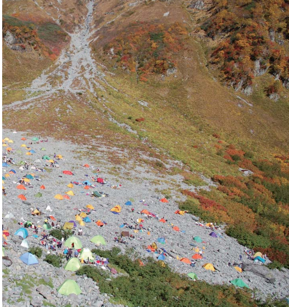
写真:秋の穂高岳潤沢カール