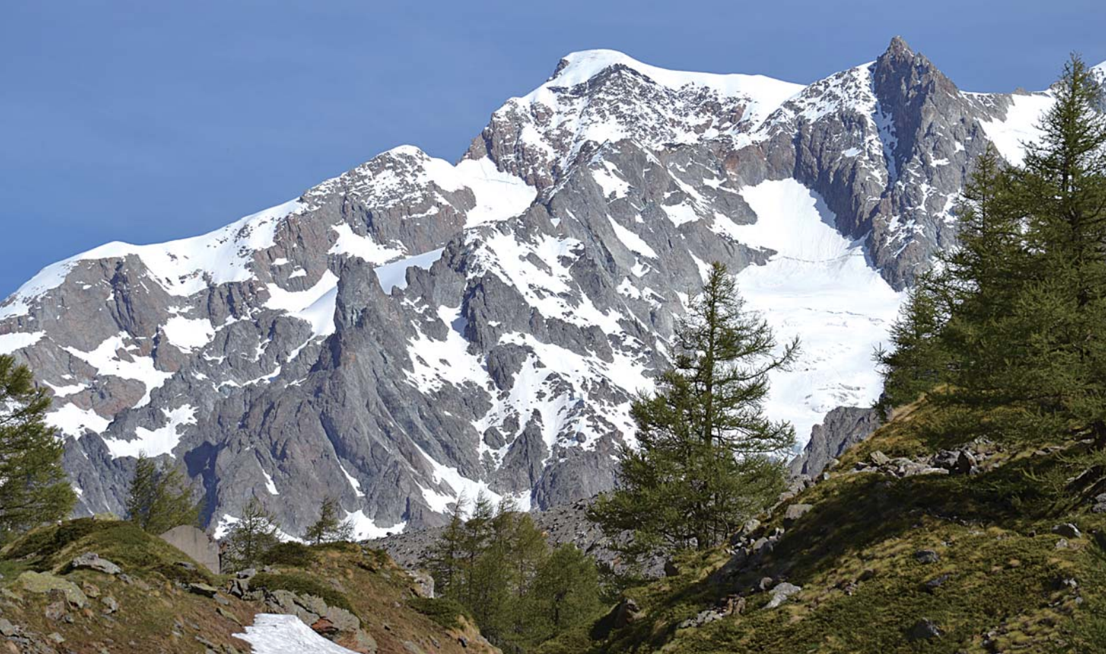
Monte Bianco, Italy