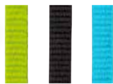
グリーン ブラック ブルー