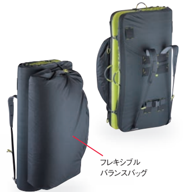
フレキシブル バランスバッグ