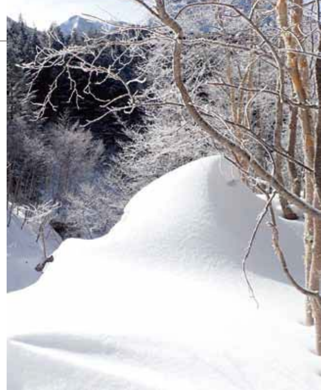
写真:ハヶ岳西面