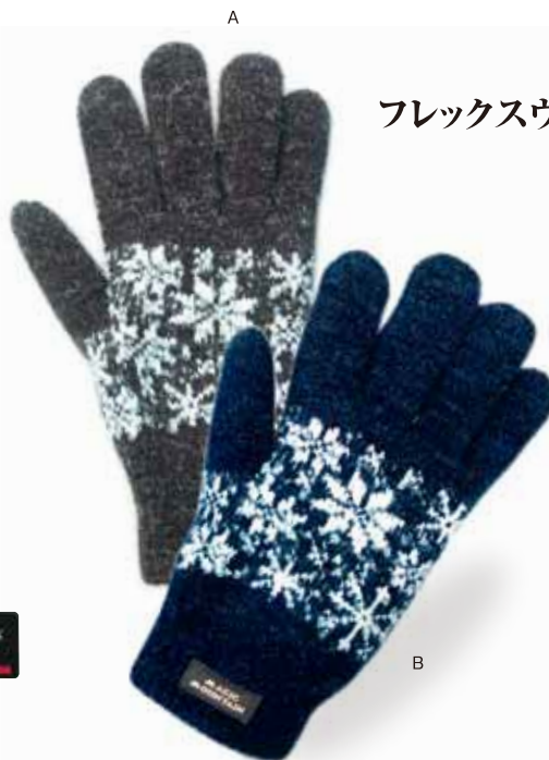
フレックスウオームグラブ