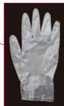
プレスマンブレン