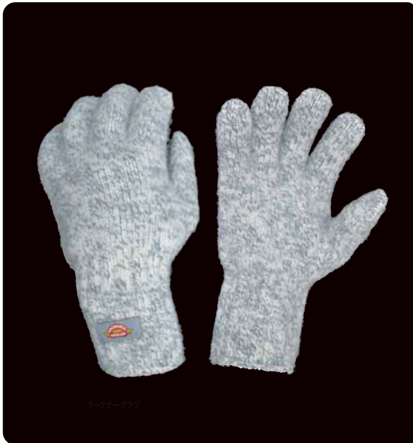
ラックナーグラブ