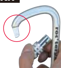
キーロックゲートのスチールDシリーズ