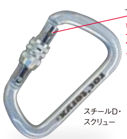
スチールD・スクリュウ