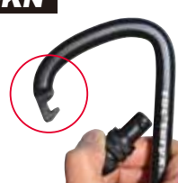
フック式ゲートのトライアングルシリーズ