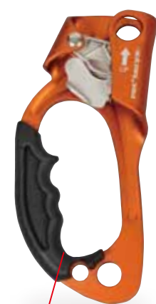
アセンドー・レフト