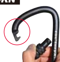
フック式ゲートのトライアングルシリーズ