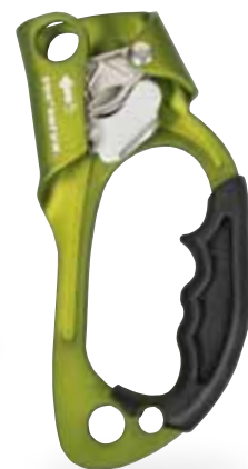
アセンドー・ライト