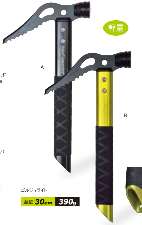
ゴルジュライト 全長 30cm 390g