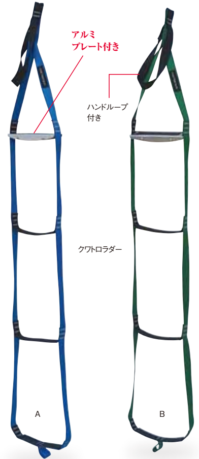
テープ幅 25mm 全長 134cm 260g