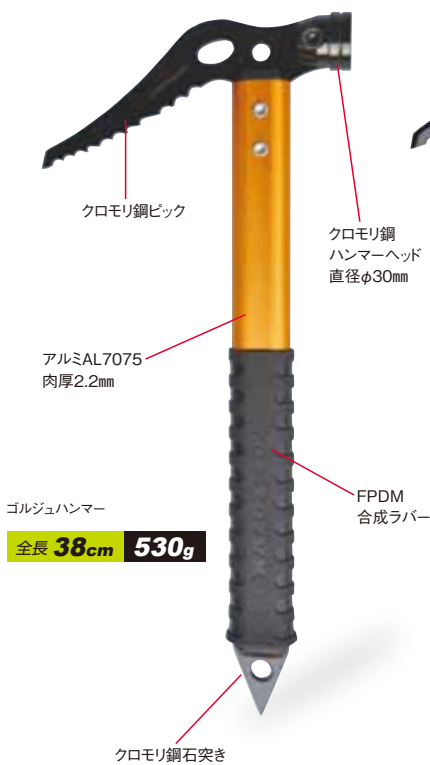
ゴルジュハンマー 全長 38cm 530g