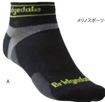
メリノスポーツ・ロー

くるぶし丈ソックス。メリノウールの保温性とフィット性に優れている。 ●素材 / メリノウール34%、ナイロン64%、ライクラ14%、ライクラ1% ●サイズ / ユニセックス S、M、L ●カラー / Aブラック、Bガンメタル