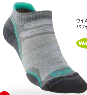
ウイメンズメリノ パフォーマンス・ロー