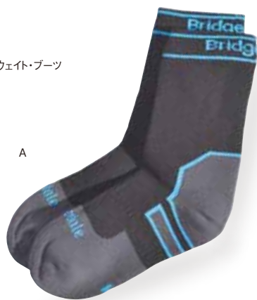
ミッドウェイト・ブーツ