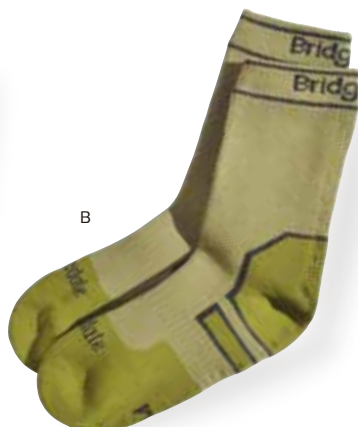
ライトウェイト・アングル