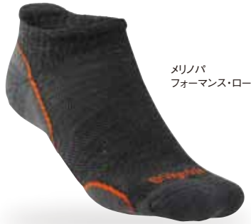
メリノパ フォーマンス・ロー