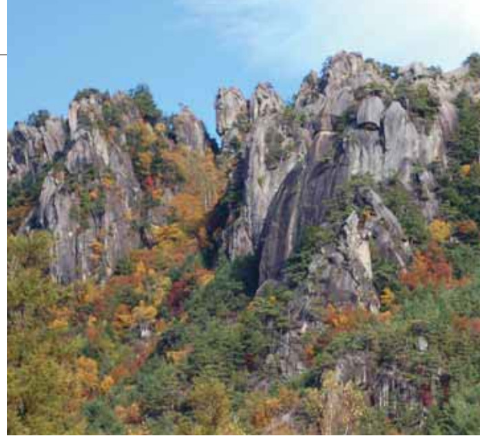
写真:小川山岩峰群

マジックマウンテンでは「支点の正しい施工法の技術講習会」を開催している団体の紹介を行っております。正しい施工法や使用法を学んでいただき安全性の高いアンカーポイントを設置して下さい。詳細は、弊社「ボルトの安全講習会係」までお問合せ下さい。