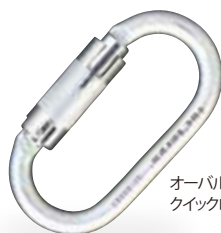
オーバルスチール・クイックロック