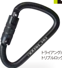
トライアングル・トリプルロック