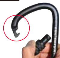
フック式ゲートの トライアングルシリーズ