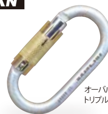
オーバルスチール・トリプルロック