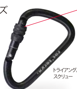
トライアングル・スクリュー