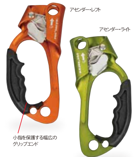
アセンドー・レフト

●サイズ/タテ径190mm ●重さ/202g ●使用ロープ径/φ8.0~13mm