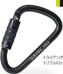
トライアングル・トリプルロック