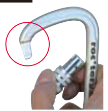
キーロックゲートの スチールDシリーズ