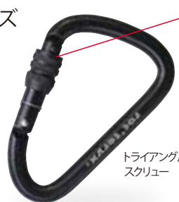
トライアングル・スクリュー