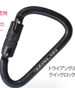
トライアングル・クイックロック