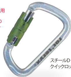
スチールD・クイックロック