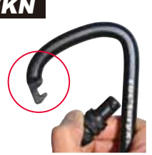
フック式ゲートの トライアングルシリーズ