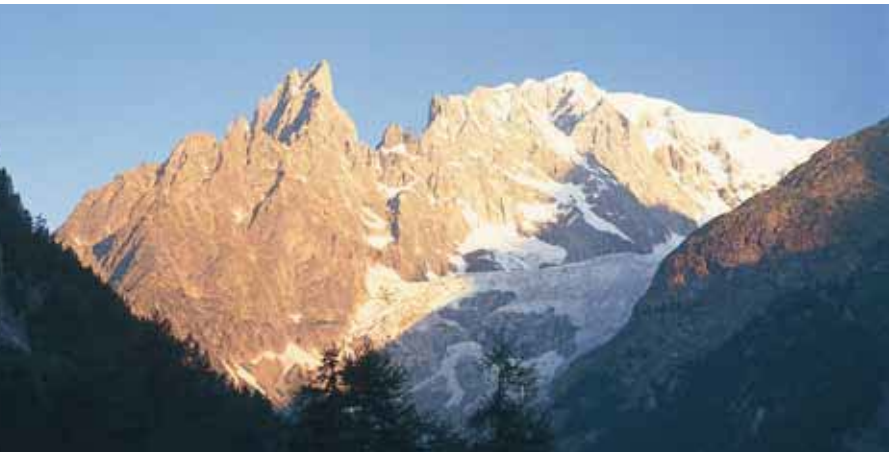
写真：アトレー針峰とモンブランプレシバフェース