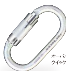
オーバルスチール・クイックロック