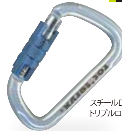
スチールD・トリプルロック