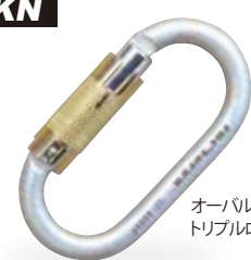
オーバルスチール・トリプルロック