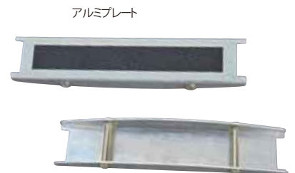
スクリーナットで取付け取外しができる。

RT QL4 ¥6,000 (税込 ¥6,600) クワトロラダー.....¥5,400(税込¥5,940) 4段のナイロンテープアブミ。各ステップには堅いプラスチック板が 縫い込んであり、最上段にはアルミニウムの踏み板アルミプレートが 固定されて全体の形状を保っています。ハンドループ付き。エイドク ライミングだけでなく岩場で初心者を安全に登らせたり、レスキュー 用具としても役に立つ。アルミプレートは取り外してもステップは安 定しているから十分に使えます。 ●素材/ナイロンウェビングテープ ●サイズ/全長134、ステップ間隔32、ステップ幅19 (cm) ●カラー/Aブルー、Bグリーン ●重量/260g