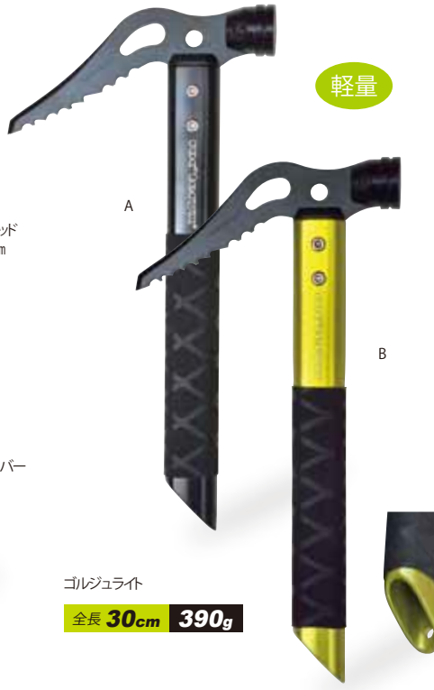
ゴルジュライト 全長 30cm 390g

RTHAMG ¥14,000 (税込 ¥15,400) ゴルジュハンマー.....¥13,500(税込¥14,850) 雪が消えた谷の草付きや堅い雪渓にピックが良く効きます。 ラバーグリップ付き。 ●素材/クロモリ鋼ヘッド、アルミシャフト ●サイズ/全長38cm、 シャフト長34cm、ピック(刃)10cm ●重さ/530g