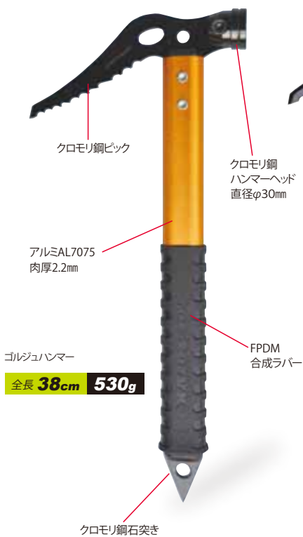
ゴルジュハンマー 全長 38cm 530g

RTHAMG ¥14,000 (税込 ¥15,400) ゴルジュハンマー.....¥13,500(税込¥14,850) 雪が消えた谷の草付きや堅い雪渓にピックが良く効きます。 ラバーグリップ付き。 ●素材/クロモリ鋼ヘッド、アルミシャフト ●サイズ/全長38cm、 シャフト長34cm、ピック(刃)10cm ●重さ/530g