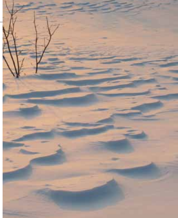
(写真)宮城蔵王駒草平