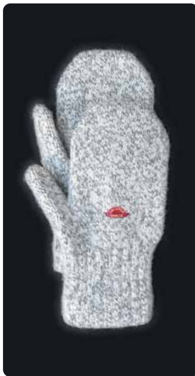
ラックナーミトン