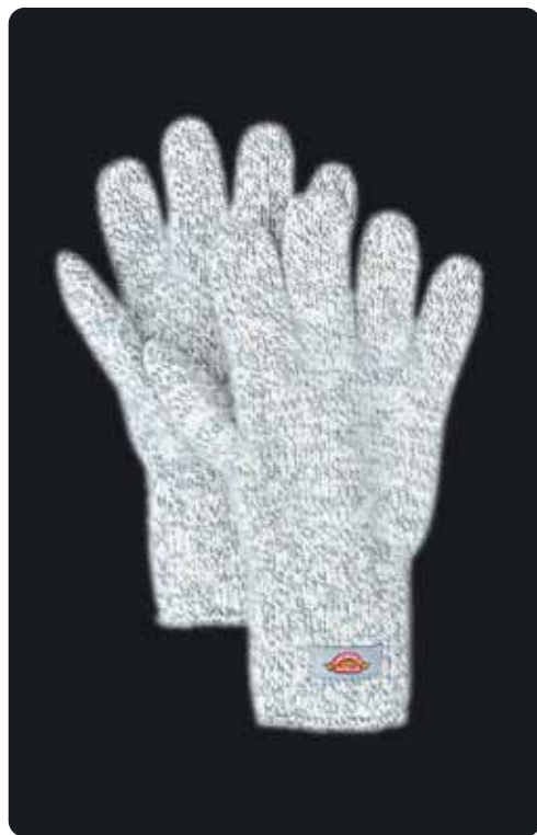
ラックナーグラブ