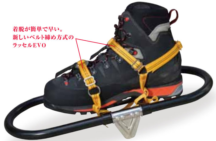
着脱が簡単で早い。 新しいベルト締め方式の ラッセルEVO