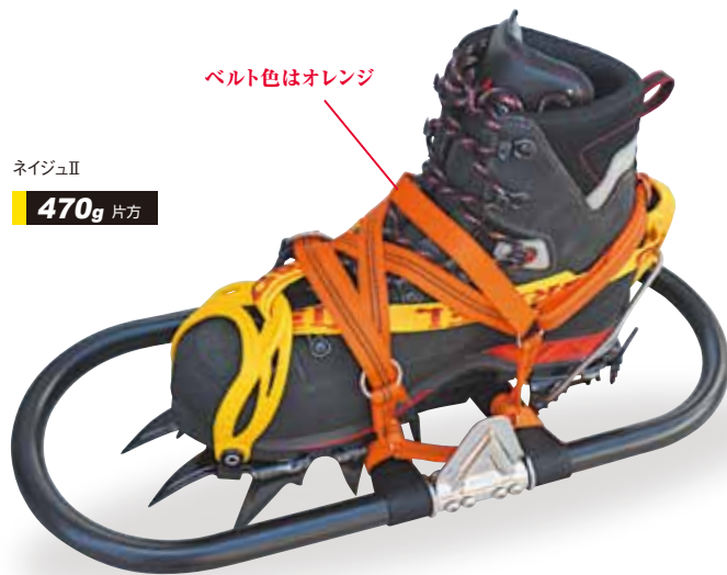
ベルト色はオレンジ

TJWN033 ラッセルEVO.....¥12,500(税込¥13,750) ベルト締め方法が従来より簡単になり着脱がす早く出来る。ポリウレタンデッキベルト。 ●サイズ/ワンサイズ長さ45、幅19(cm) ●重量/500g(片方) ●フレームカラー/ブラック