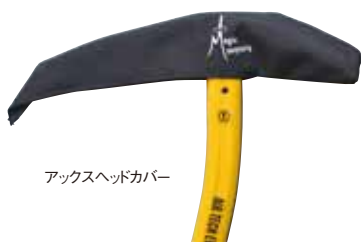
アックスヘッドカバー