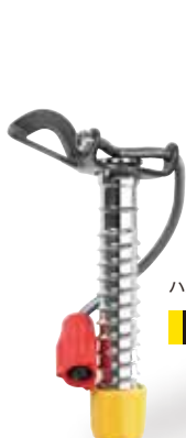
ハンドルスクリュウ-S 160g