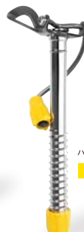
ハンドルスクリュウ-L 215g

GV-IS251S ハンドルスクリュウ-S(12cm) …… 定価¥8,200(税込¥9,020) ●重量/160g●ブラックホール付き