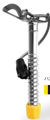
ハンドルスクリュウ-M 190g