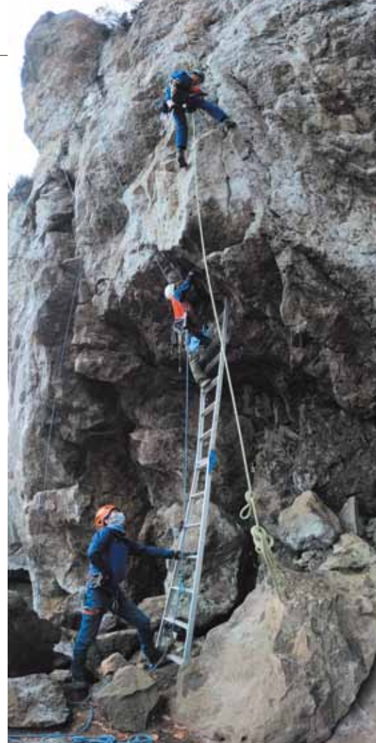
写真:リボルト作業

マジックマウンテンでは、これらの「支点資材の正しい施工法の技術講習」(古いボルトの撤去方法を含めた施工者向けのリボルト講習)と、一般ユーザー向けの「ボルトの安全講習会」を開催している団体の紹介を行っております。正しいボルトの施工法や使用方法を学んでいただき安全性の高いクライミングをお楽しみいただきたいと思います。詳細は、弊社「ボルトの安全講習会係」までお問合せください。