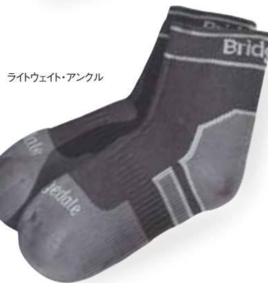
ライトウェイト・アングル