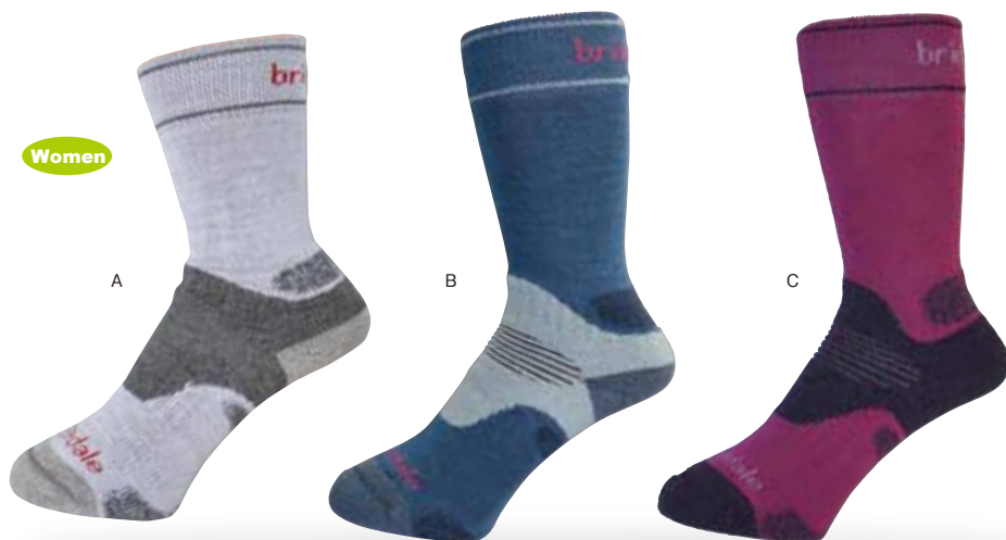
ウイメンズ パフォーマンス・ハイク