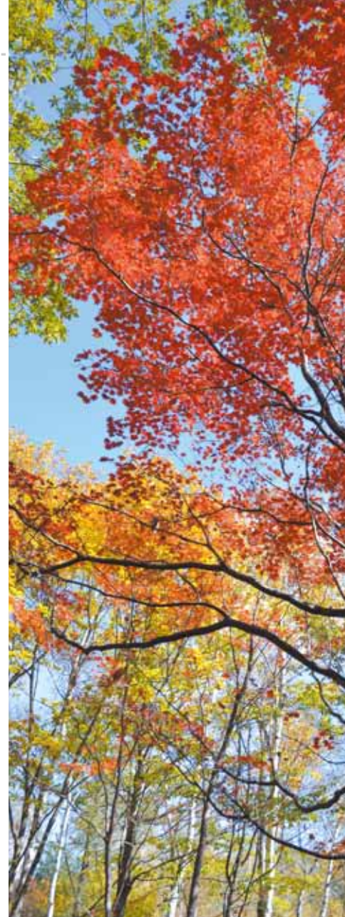
撮影地:奥秩父金峰山麓