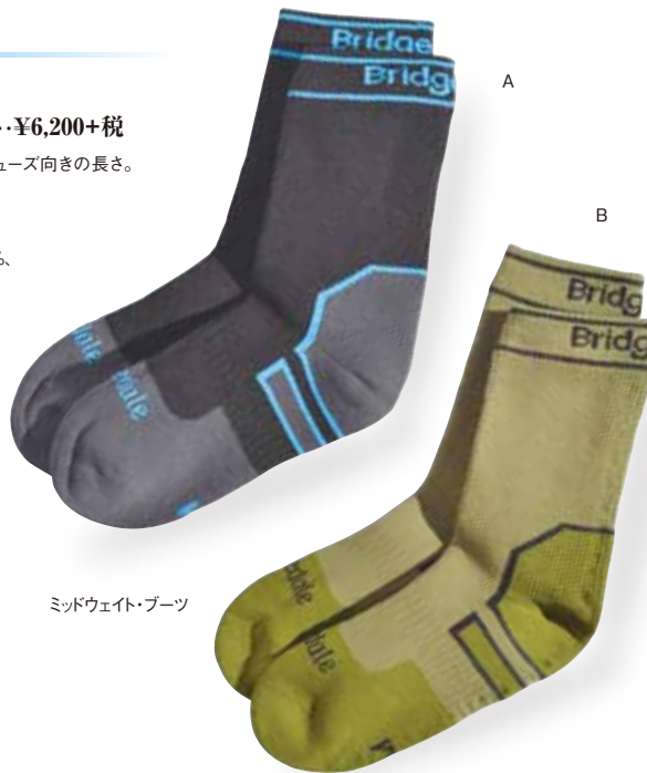
ミッドウェイト・ブーツ