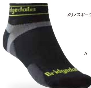
メリノスポーツ・ロー