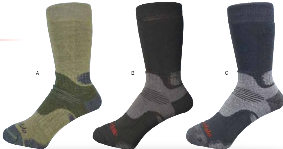
パフォーマンス・ハイク