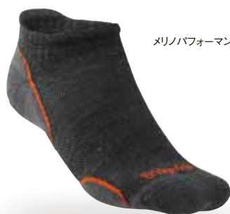
メリノパフォーマンス・ロー