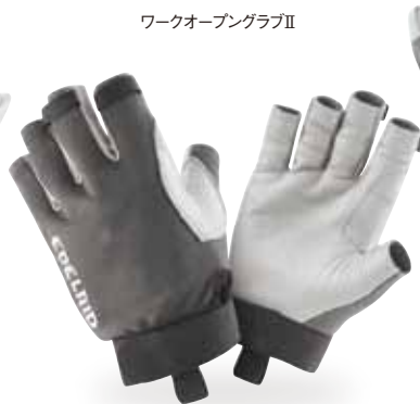
ワークオープングラブⅡ

●素材/甲:ポリエステル、エラストン、バーム:カーフスキン(子牛の皮) ●サイズ/XS、S、M、L ●カラー/チタン