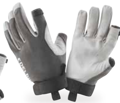
ワーククローズグラブⅡ

●素材/甲:ポリエステル、エラストン、バーム:カウハイド(牝牛の皮) ●サイズ/XS、S、M、L ●カラー/チタン