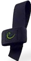
ハンマーホルスター