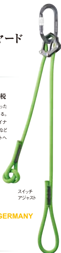
スイッチアジャスト