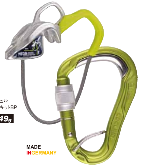
メガジュル ビレーキットBP 149g

ブレーキアシスト機能がより安全なビレーイングを実現する。ステンレススチール製。軽量で耐久性がある。セカンドビレー、懸垂下降にも対応する。●重さ/65g●適応ロープ径/φ7.8~10.5 (mm)