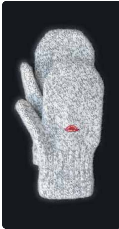
ラックナーミトン