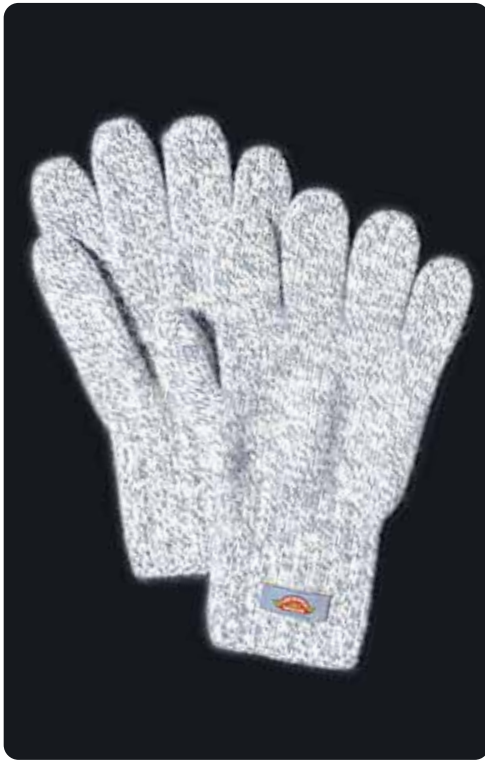
ラックナーグラブ