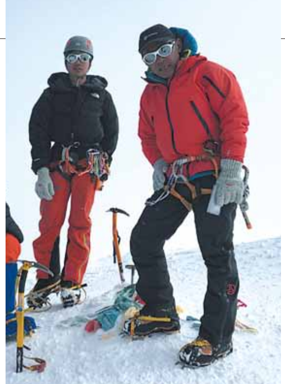
写真：デナリ(Mt.マッキンリー)頂上