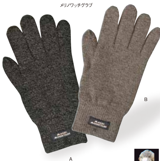
メリノワッチグラブ