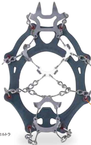
アイレット プロテクター