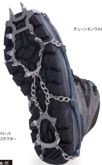
チェーンセンウルトラ