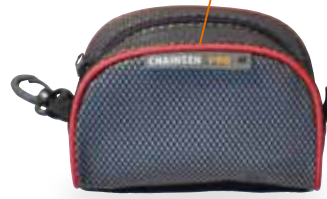
チェーンセンプロ 専用防水ケース

バイピングカラーがサイズによって異なります。 Sオレンジ、Mレッド、Lブルー、XLグレー ●サイズ/15×11×6(cm)