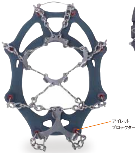
アイレット プロテクター