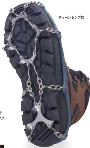
チェーンセンプロ