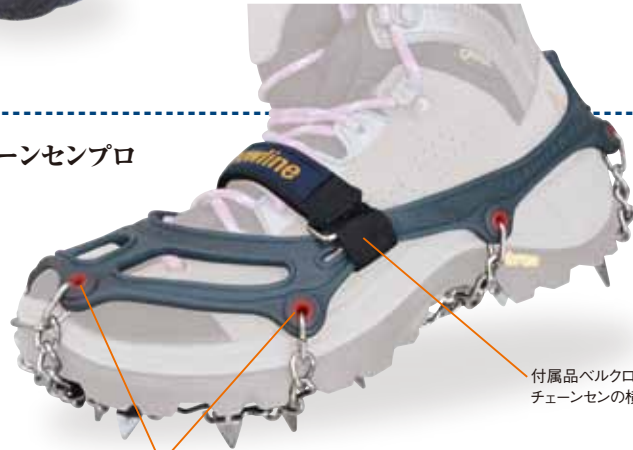
付属品ベルクロストラップ チェーンセンの横づれを防ぐ