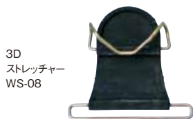
3D ストレッチャー WS-08