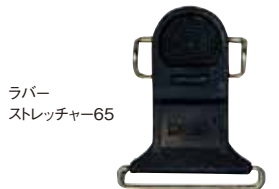
ラバー ストレッチャー-65