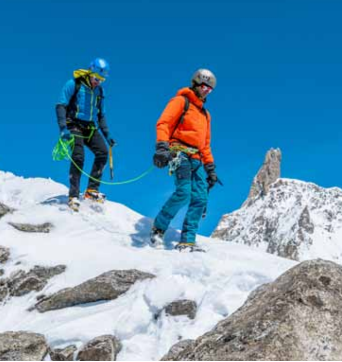
Location: Monte Bianco