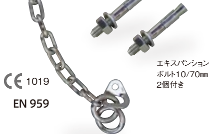
エキスパンション ボルト10/70mm 2個付き