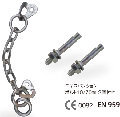
エキスパンション ボルト10/70mm 2個付き