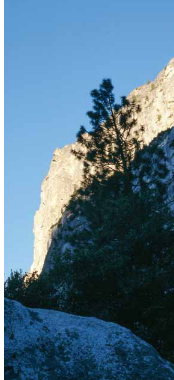
写真: エルキャピタン曙光、ヨセミテ California U.S.A

RT7358CHA+B70 ラッペルステーション8Cボルトセット(2本) ..... 定価 ¥5,100+税 ●重さ / 722g(セット) ※エキスパンションボルト10/70mm 2個付き