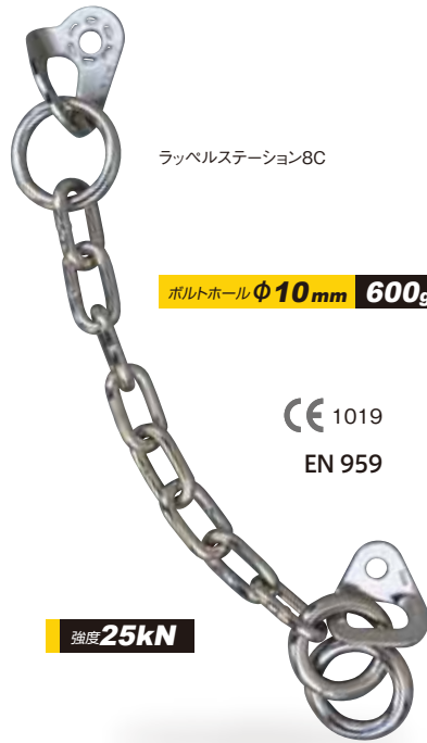
ラッペルステーション8C