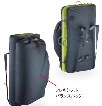
フレキシブル バランスバッグ