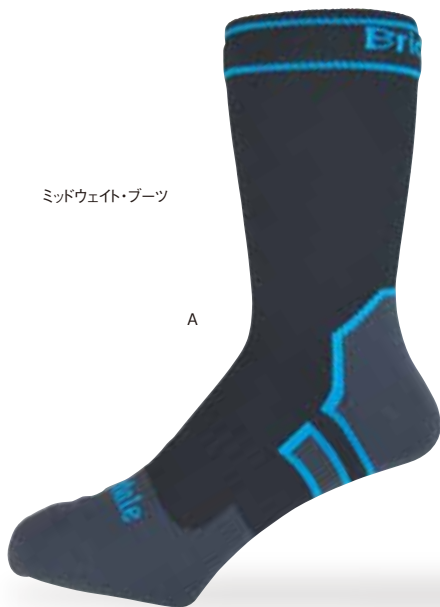
ミッドウェイト・ブーツ