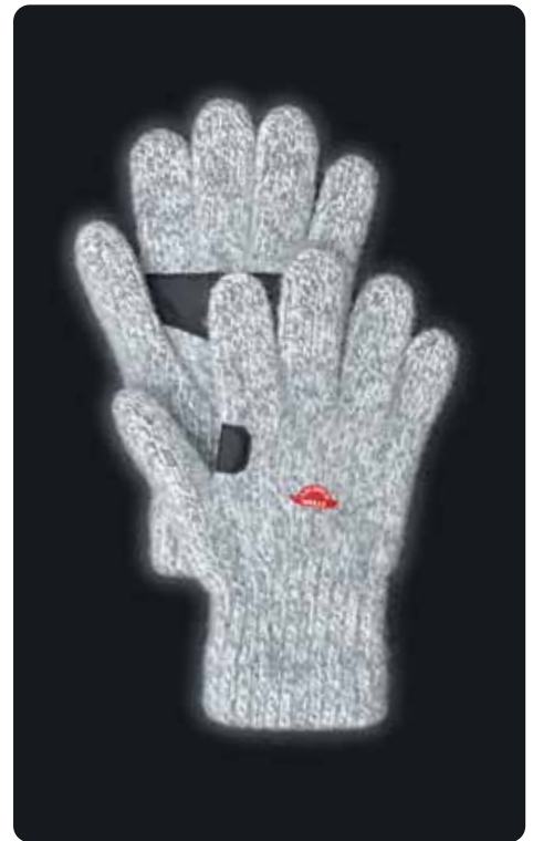
ガイドプログラブ