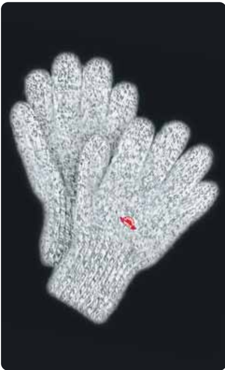
ヒマラヤングラブ