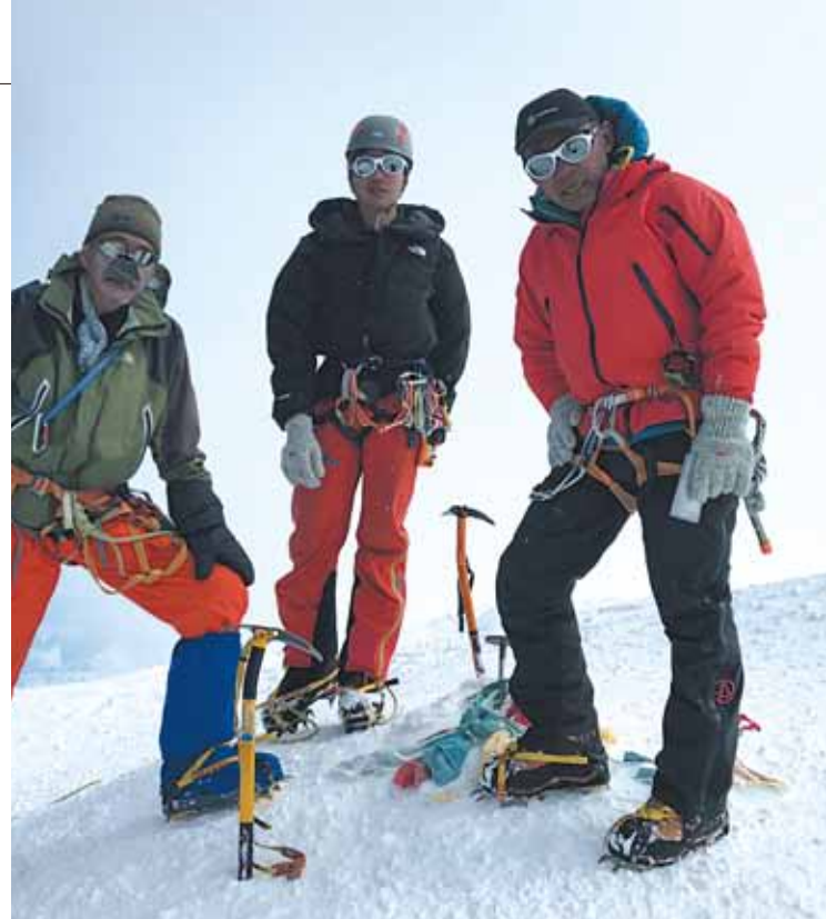
写真：デナリ(Mt.マッキンリー)頂上(2019年6月)