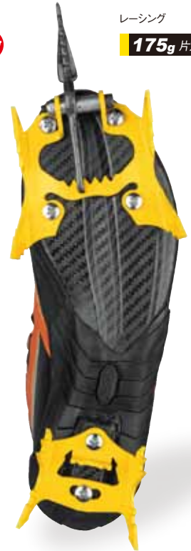
GV-RA089.00 レーシング.....定¥18,000+税 アイスクライミング、ドライツールーリング、コンペティション専用クランボン。シューズに直接取り付ける為、クランボンとシューズとのずれが生じない。的確にポイントを捉えることができる。 ●重量/175g(片方)