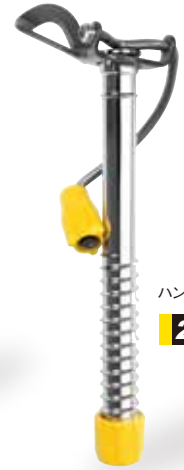
ハンドルスクリュー-L 215g