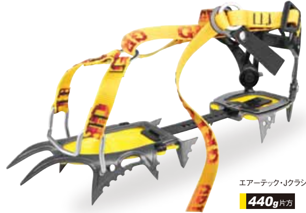
エアータック・Jクラシック 440g 片方