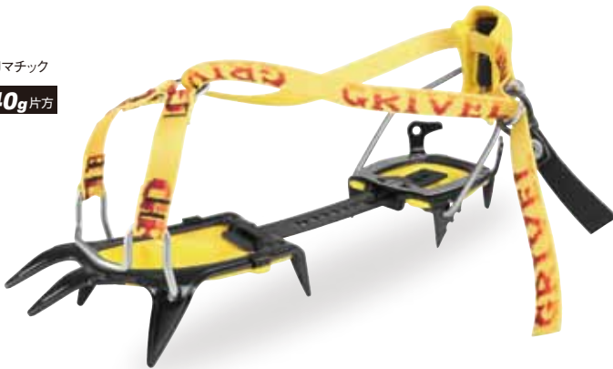
G10・Jマチック 440g 片方

GV-RA073A08 エアータック・Jクラシック……………¥17,200+税 ナイロンベルトのフロントハーネス。後ろはプラスチックハーネス。●重量／440g(片方)