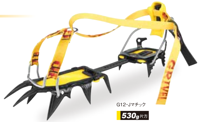
G12・Jマチック 530g 片方