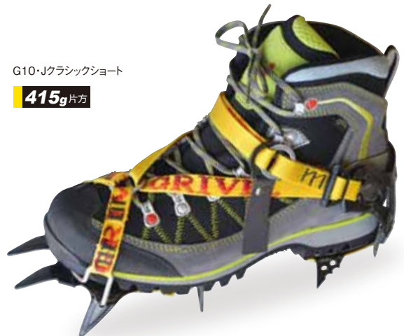
G10・Jクラシックショート 415g 片方

GV-RA072A07 G10・Jマチック……………¥15,300+税 かかとにはバイディング止め。スリーシーズン用ブーツへ対応する。 ●重量／440g(片方)