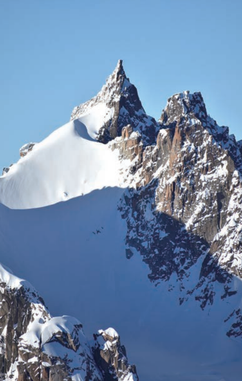
Aig Du Plan (Chamonix FRANCE)