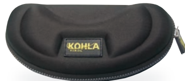
サングラスケース