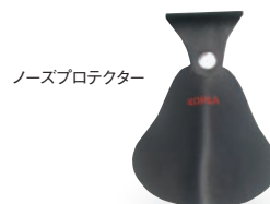
ノーズプロテクター