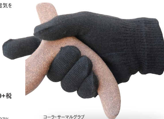
コーラ・サーマルグラブ