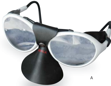
ヒマラヤングラス