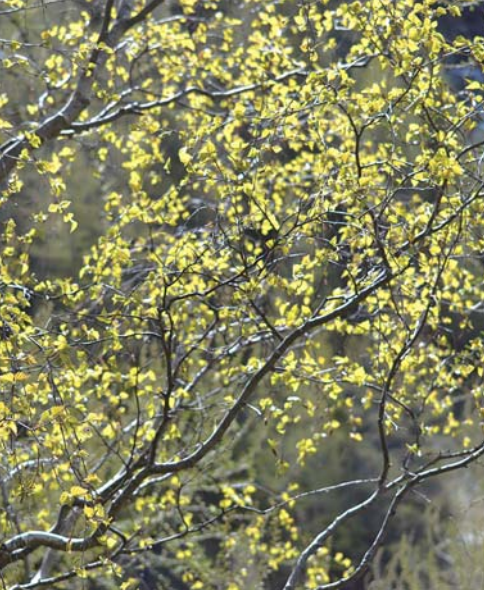
Location: Val Venny Monte Bianco