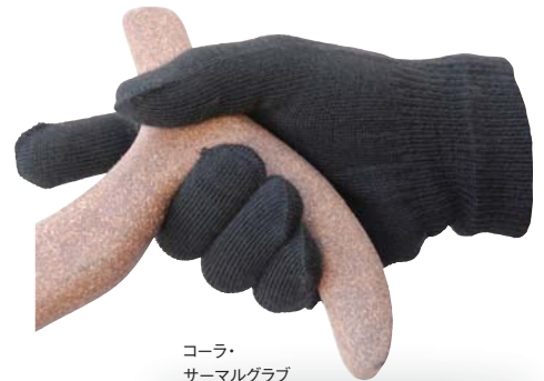
コーラ・サーマルグラブ