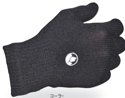
コーラ・コンフォートグラブ