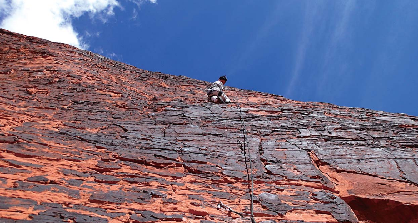
Climber: Taeko Yamanoi Location: Red Rock (Nevada USA)