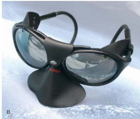
ヒマラヤングラス 重量 43g ★サングラスケース付き