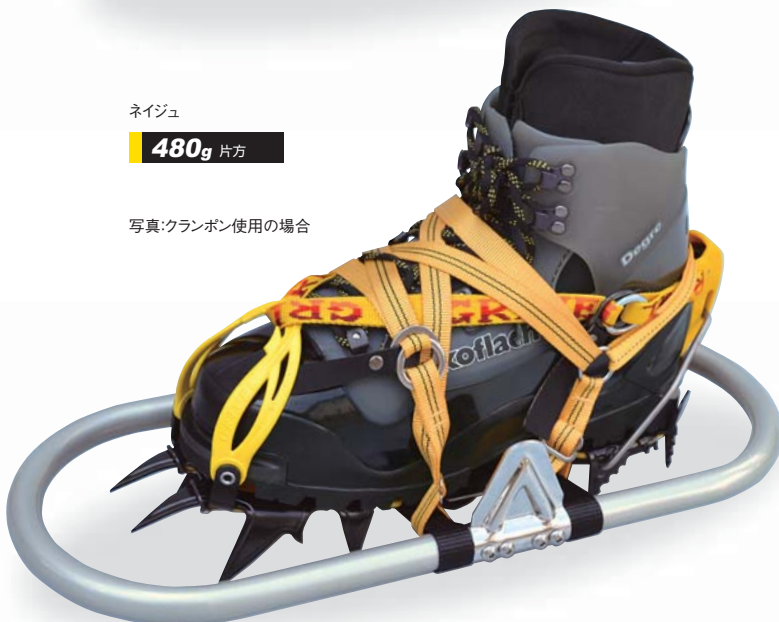
写真: クランボン使用の場合