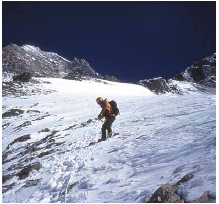
写真: 山野井泰史, K2南南東リブ