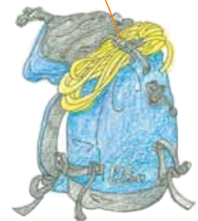
イラスト: 橋尾歌子