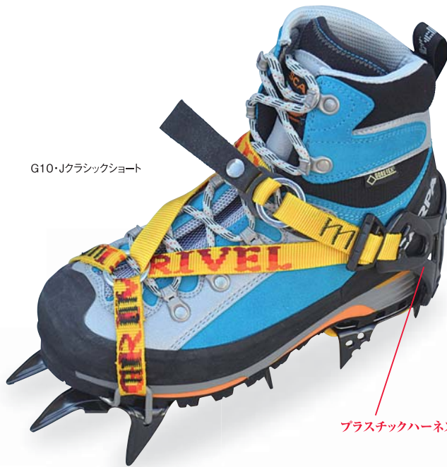
G10・Jクラシックショート