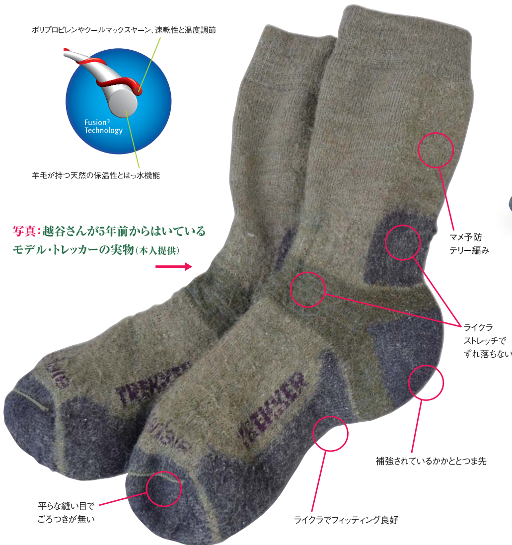
写真: 越谷さんが5年前からはいているモデル・トレッカーの実物(本人提供)