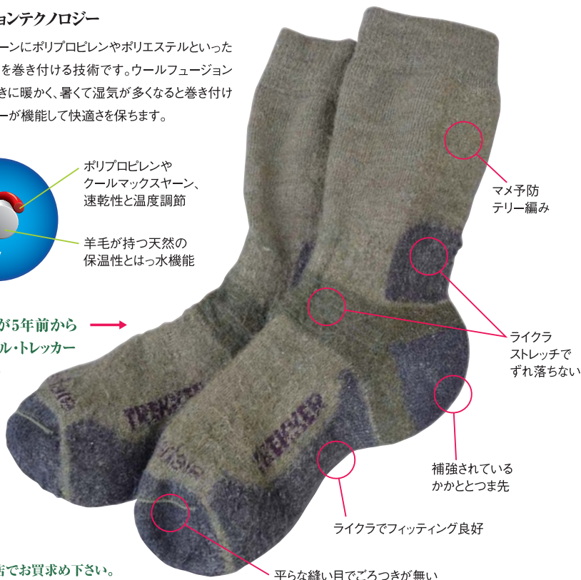
写真: 越谷さんが5年前からはいているモデル・トレッカーの実物

ポリプロピレンやクールマックスヤーン、速乾性と温度調節 羊毛が持つ天然の保温性とはっ水機能