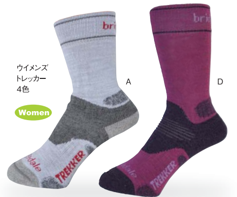
ウイメンズ トレッカー 4色

湿気蒸散性能が良い。マメが出来にくいライクラ編み込み。 ●サイズ/ユニセックス S、M、L ●カラー/Aグレー、Bグレー、Cブラック、Dガンメタル ●素材/ビュアーウール44%、ナイロン38%、ポリプロピレン17%、ライクラ1%