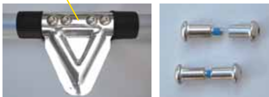
弛み止めスクリューとナット