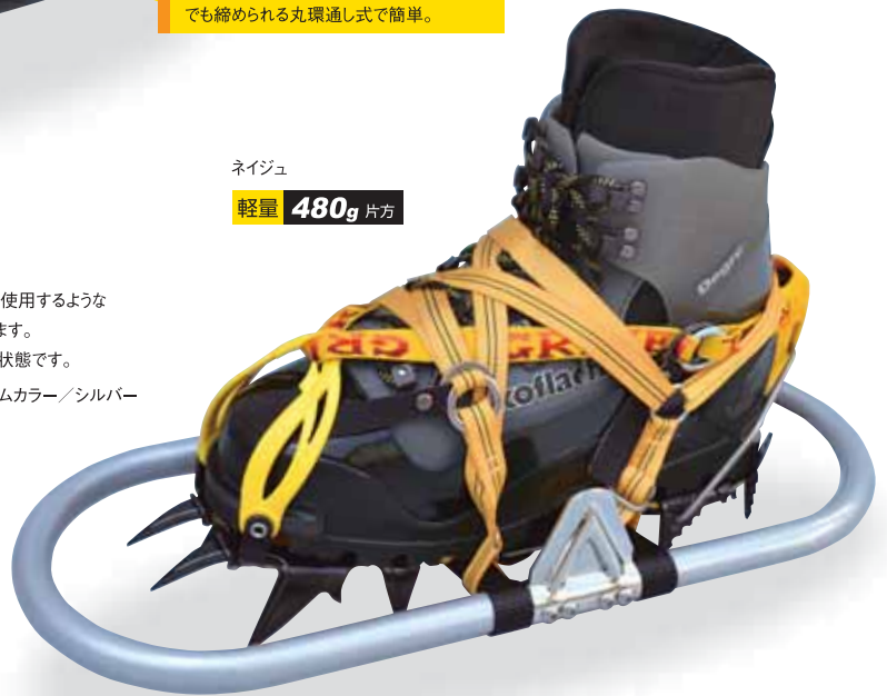
写真: クランポン使用の場合