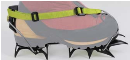
つま先、かかと共にコバがあるシューズ フロント、バック共にオートバイディングにする。