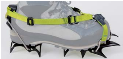
つま先コバが無いシューズ／フロントはソフトバイディングにする。