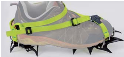
ローカットシューズ／フロント、バック共にソフトバイディングを付ける。