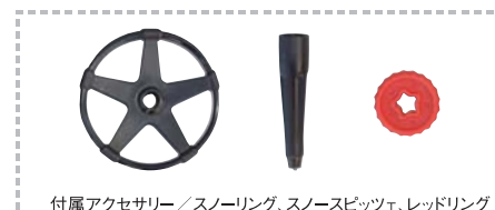
付属アクセサリー/スノーリング、スノースピツェ、レッドリング