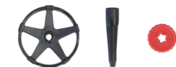
付属アクセサリー/スノーリング、スノースピツェ、レッドリング