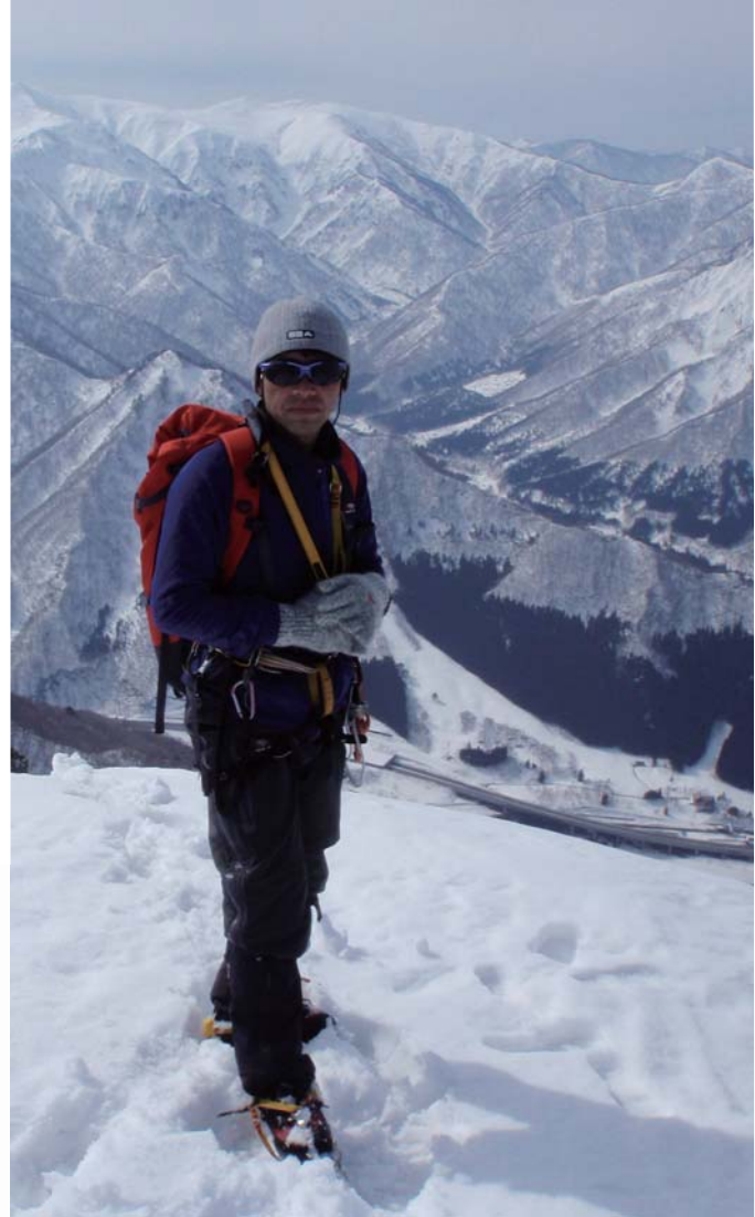
写真：山野井泰史(上越・荒沢山)