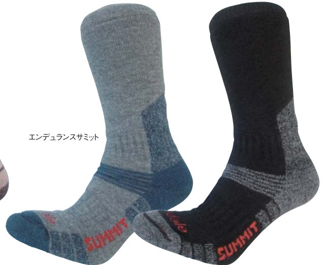
エンデュランスサミット